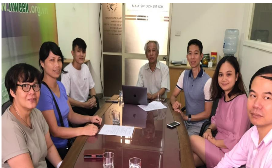
Họp trừ bị đại hội thành lập VLSP

Câu lạc bộ Xử lý Ngôn ngữ và Tiếng nói Tiếng Việt (gọi tắt theo viết tắt tiếng Anh của Vietnamese Language and Speech Processing là VLSP), chi hội của Hội Tin học Việt Nam được chính thức thành lập thông qua Đại hội thành lập được tổ chức hoàn toàn trực tuyến vào ngày 27/6/2020.